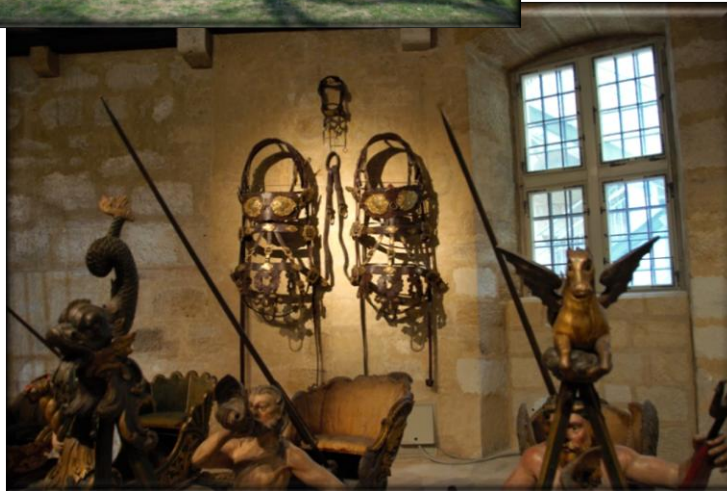
Bildimpressionen: XXVIII. Internationalen Fahrsportsymposium in Coburg 2019